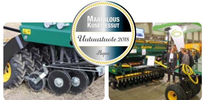
Suuri vannaspainatus (80 kg) yleiskylvökoneeseen

Tee joulukuun aikana 12.500 € (alv 0%) työkone- tai hallikauppa, saat 200€:n lahjakortin kylpylään!