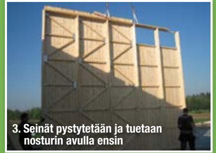
3. Seinät pystytetään ja tuetaan nosturin avulla ensin