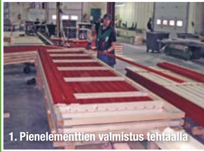
1. Pienelementtien valmistus tehtaalla