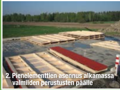
2. Pienelementtien asennus alkamassa valmiiden perustusten päälle