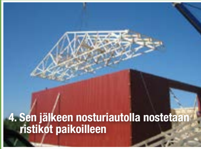
4. Sen jälkeen nosturiautolla nostetaan ristikot paikoilleen