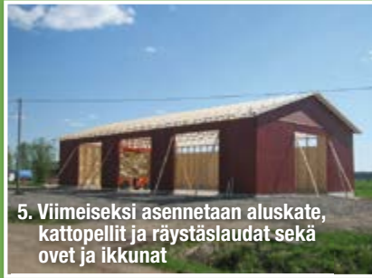
5. Viimeiseksi asennetaan aluskate, kattopellit ja räystäslaudat sekä ovet ja ikkunat